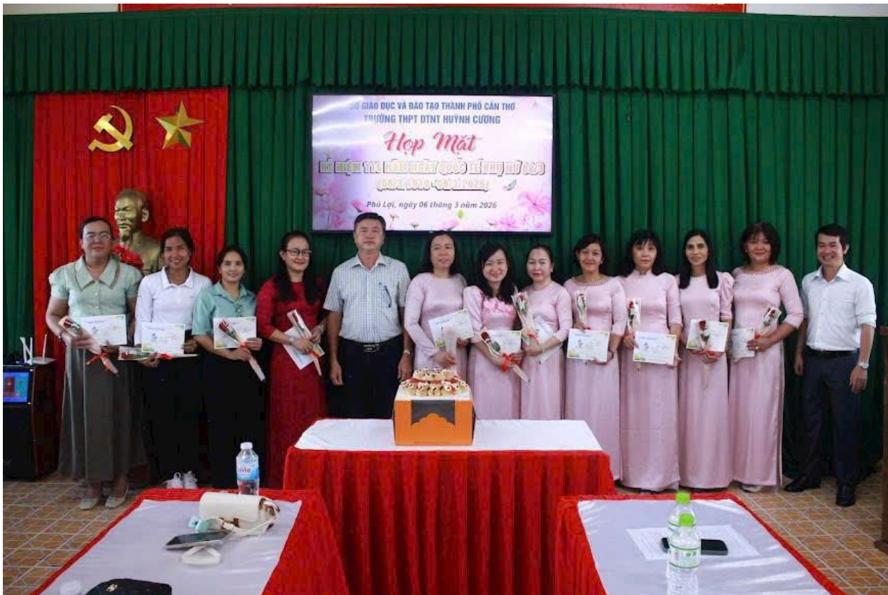
Hình ảnh cán bộ, giáo viên, nhân viên nữ nhận hoa và quà của Ban Giám hiệu